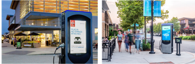
[그림 2] 볼타의 무료 EV 충전소